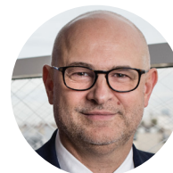
Laurent PIETRASZEWSKI Ancien ministre en charge des retraites et de la santé au travail et fondateur du cabinet de conseil Grenel GRENEL