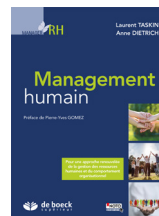
Co-Auteur de l'ouvrage : « Management humain »