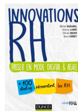
Co-Auteur de l'ouvrage : « Innovations RH : Passer en mode digital & agile »

Quel sera le poids de l'innovation dans les métiers de gestion des ressources humaines de demain ? Intelligence artificielle, blockchain, Internet des objets, réalité virtuelle... Alors que la transformation numérique est en marche dans toutes les fonctions de l'entreprise, la fonction RH tarde à intégrer digital et agilité. Pourtant, ces innovations donnent aux RH un rôle nouveau dans les décisions stratégiques des organisations. Car développer de nouveaux outils, de nouvelles compétences, de nouveaux process agiles et collaboratifs est plus que jamais essentiel pour attirer, fidéliser les nouveaux talents.