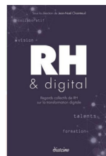
Auteur de l'ouvrage : « RH & Digital »

On parle beaucoup du travail de demain mais si nous étions déjà en retard ? De nouvelles formes de contrat, d'outils et d'usages ont bouleversé nos méthodes et nos environnements de travail. Comment peut-on gérer ces nouveaux employés ? Comment devenir un nouvel employeur de choix ? Quels sont les premiers pas à faire pour vivre (et non plus subir) les transformations digitales ?